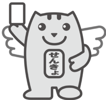
みんなの一票大切に！