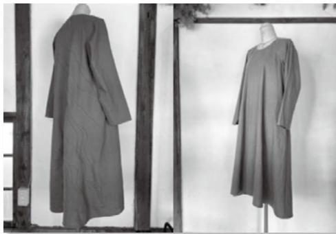
波のピンタックアートワンピース