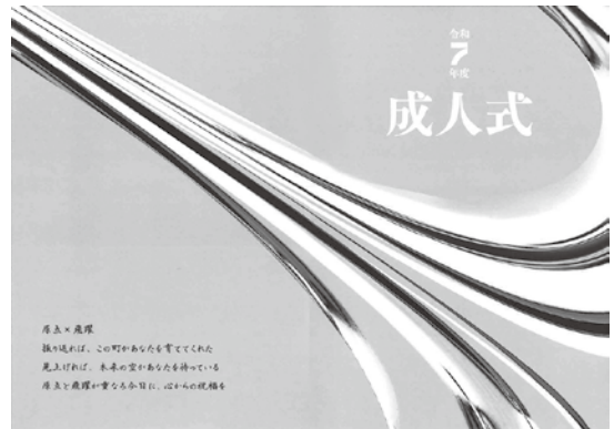
令和7年度成人式プログラム