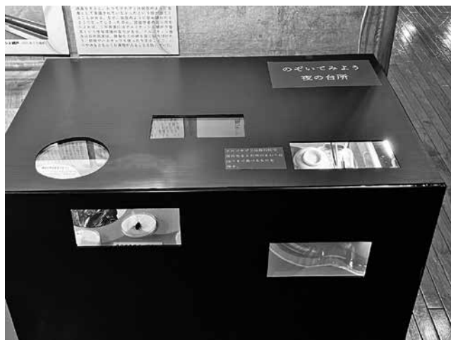
▲「のぞいてみよう 夜の台所」展示の様子

よく見かける生き物でも実はじっくり見ていないこともあります。この冬、資料館に身近な生き物の面白いところ、すごいところを見つけに来ませんか。