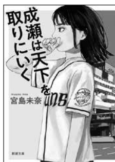
成瀬は天下を取りに行く 宮島 未奈/著 新潮社