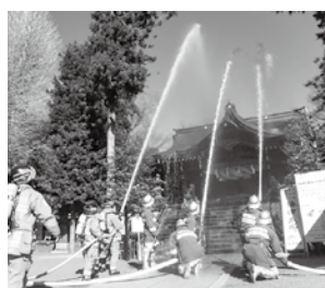
令和6年度の様子(六所神社)

訓練当日は、消防車のサイレン吹鳴がありますのでご承知おきください。荒天や警報発令、火災・災害発生等により、中止する場合があります。