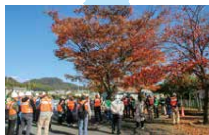
晩秋の大磯町総合防災訓練