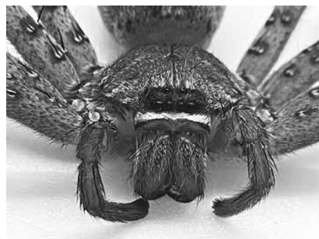
▲アシダカグモの顔

今回の展示では私たちの生活に最も近いムシたちを取り上げています。自然の分野ではハエやゴキブリ、ムカデなど身近なムシ7種類の標本、その生態や形態などを紹介しています。特にそれぞれのムシが、捕食のため、また天敵から身を守るために身につけたすごい能力について知ることができます。