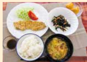
右上のおかずがひじきサラダ

皆さんは健康診断を定期的に受けていらっしゃる吗。結果の数値が気になる方や改善に向けて取り組みをされている方、そのご家族、まだまだ関係ないと思っいらっしゃる方も是非ご参加ください。