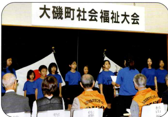
▲ 大磯小学校合唱団による歌唱

肌寒い天気でしたが、各団体の出店コーナーにもたくさんの方においでいただきました。ご来場いただいた皆さま、ご協力いただいた皆さま、本当にありがとうございました。