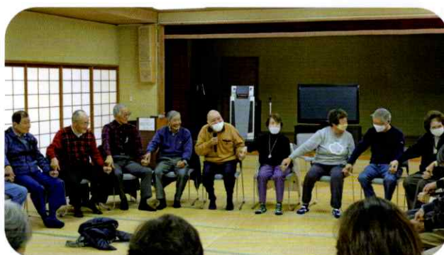
▲ 参加者が輪になって全体で運動する様子