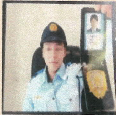
実際に使われたニセ警察官の画像 (画像の一部を加工)