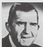
P・デイブ・ホール (当時デイトン市長)