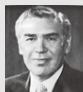
ウィリアム・S・アンダーソン (当時デイトン市長)