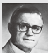
スティーブ・F・オルセン (当時ランシ市長)