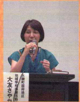
今年度は私も事例発表の機会が与えられ、国府地区の地域コーディネーターとしてのこれまでの取り組みを具体的にお話ししてきました。

国府小学校環境学習調整・国府小学校水泳授業ボランティア募集・国府小学校郷土資料館出張展示調整・国府中学校職場体験依頼・国府中学校マナー講座依頼・国府中学校SNS講座依頼・たかとり幼稚園フェンスアート企画・地域子ども会相談・各種ボランティア活動参加など