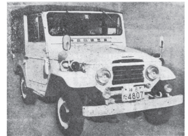
当時のパトカー 『広報大磯』より