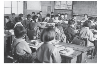
1964年3月の大磯小学校給食献立・給食の様子