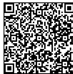
▲施設予約サービス