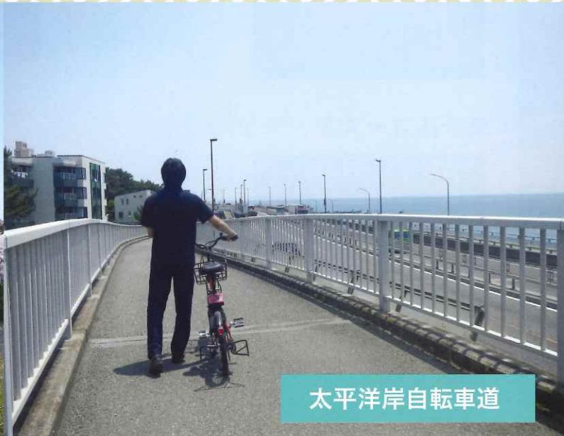
太平洋岸自転車道