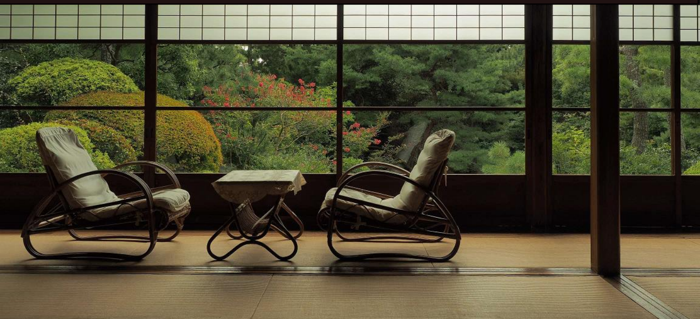
写真: 明治記念大磯邸園 陸奥宗光別邸跡・旧古河別邸 和室