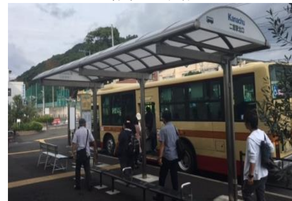
【参考価格：1基あたり約330万円】 （二宮駅北口バス停屋根）