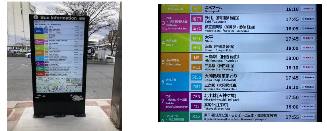
デジタルサイネージのイメージ