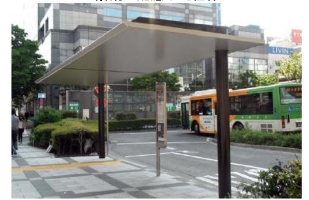
【参考価格：1基あたり約740万円】