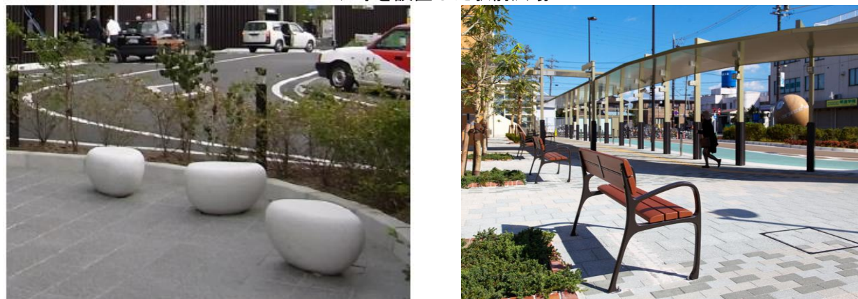
ベンチ等を設置した駅前広場