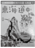
古の日本を文化と歴史を訪ねる道 五街道

冬休みに向けて、心温まるすいせん図書リストを学年別に用意しました。その中から、5・6年生向けの1冊をご紹介します。