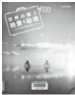
『世界の極上絶景・秘境』