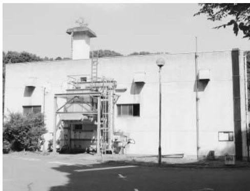
▲改修が進められるし尿処理施設

平成22年度から平塚市のし尿と浄化槽汚泥を、町のし尿処理施設で受け入れるため、施設改修を実施しています。