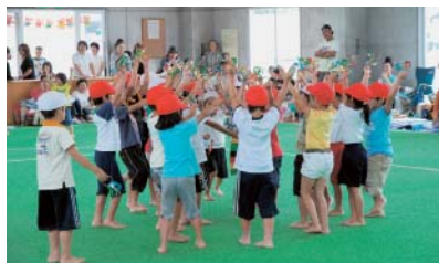
①国府保育園運動会(9/19)