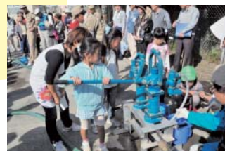
⑥水を汲み上げるのは大変!!