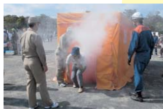
⑤火災時の煙を体験