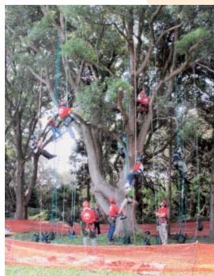
③万台こゆるぎの森でツリークライミング