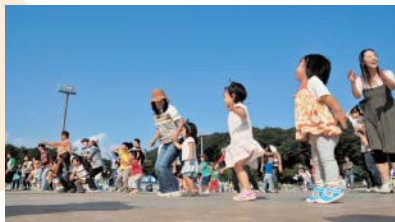
④みんなで思いっきり体を動かしました