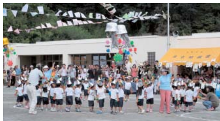
②月京幼稚園運動会(9/27)