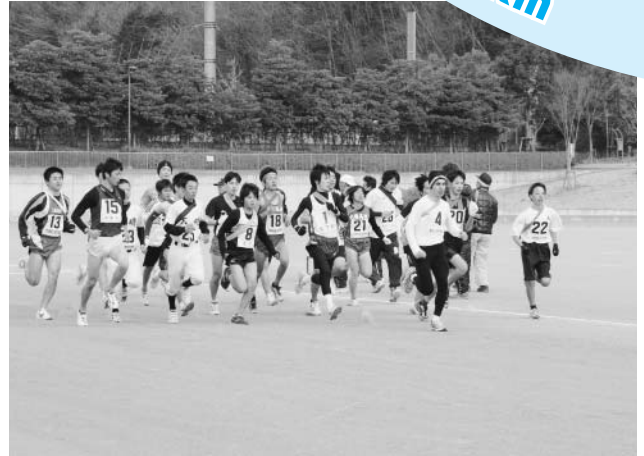
▲昨年実施した駅伝大会のスタート直後