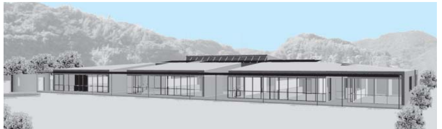
▲新幼稚園 完成予想図

平成22年4月より月京幼稚園が現在の場所から移転し、新たな幼稚園として開園します。移転するにあたり、新しい幼稚園の名称を募集いたします。