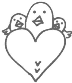
▲まごころいっぱい 本の宅配便

宅配サービスを利用できる方は、おおむね65歳以上のひとり暮らしで来館困難な方、または身体障害者手帳をお持ちの方で2級以上の一部の方です。手続きは本人または代理の方でも行えます。図書館カウンターまたは、ファックス(61)7913にて受付しています。お気軽にお申込みください。