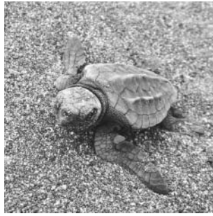
▲砂中から脱出した子ガメ

本町の海岸において、5年ぶりにアカウミガメの産卵・孵化が確認されました。産卵から孵化までの記録を写真や剥製、卵殻など今回の調査で得られた資料とともに紹介します。