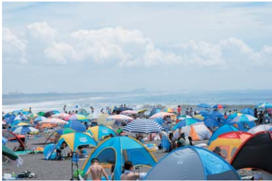
①たくさんのパラソルが砂浜を色どりました(8/9)