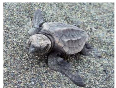
生まれたばかりのアカウミガメの仔ガメ (8/9 小磯の海岸)

香ばしい匂いに誘われ「1本くださ〜い」(7/25) なぎさの祭典会場。姉妹都市中津川市の「ごへー餅」販売