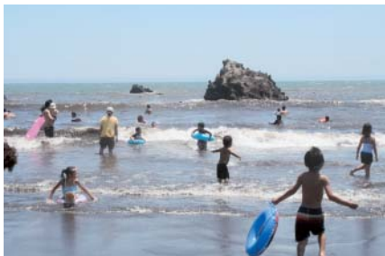
③子ども連れでにぎわう北浜海岸(7/26)