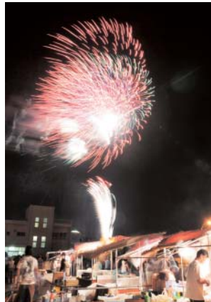
②強風の中で打ち上げられた花火(7/25)