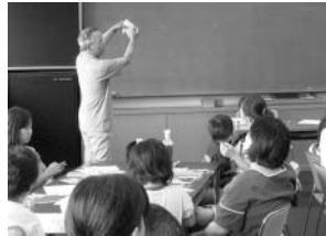
▲昨年の教室のようす