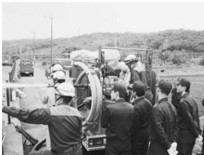
▲消防車両の性能検査の様子

また東の池では、消防ポンプ自動車と可搬ポンプの性能検査を行いました。この検査は、ポンプの真空試験、放水量試験で、ポンプの規格に相当する性能があるかの検査です。検査の結果すべてのポンプが適合していることを確認しました。