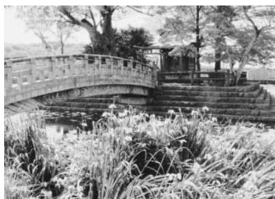
▲5月上旬には黄菖蒲が見頃となる東の池

5月上旬に行ってみると、黄色いしょうぶの花が池のまわりに咲いていました。池にはアメンボや大きいオタマジャクシがいましたが、他にもザリガニやブラックバスもいるそうです。