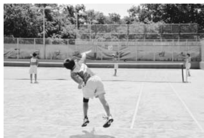
▲盛り上がった町民テニス大会

5月10日(日)に大磯中学校で大磯町民テニス大会がありました。ほかに、会場は運動公園、国府中学校がありました。