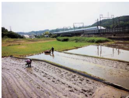
①田植え始まる・寺坂(6/2)