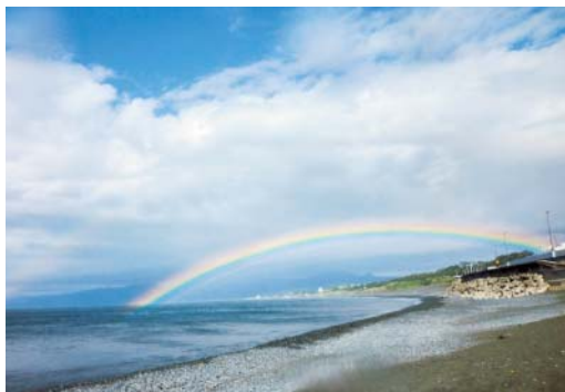
③虹の架け橋・照ヶ崎海岸(5/29)