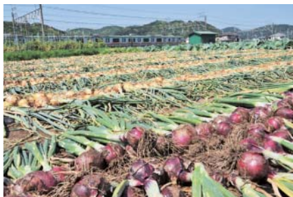
②玉葱の収穫(早生・レッド) 西小磯(5/20)