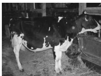
未經産リザーヴチャンピオン