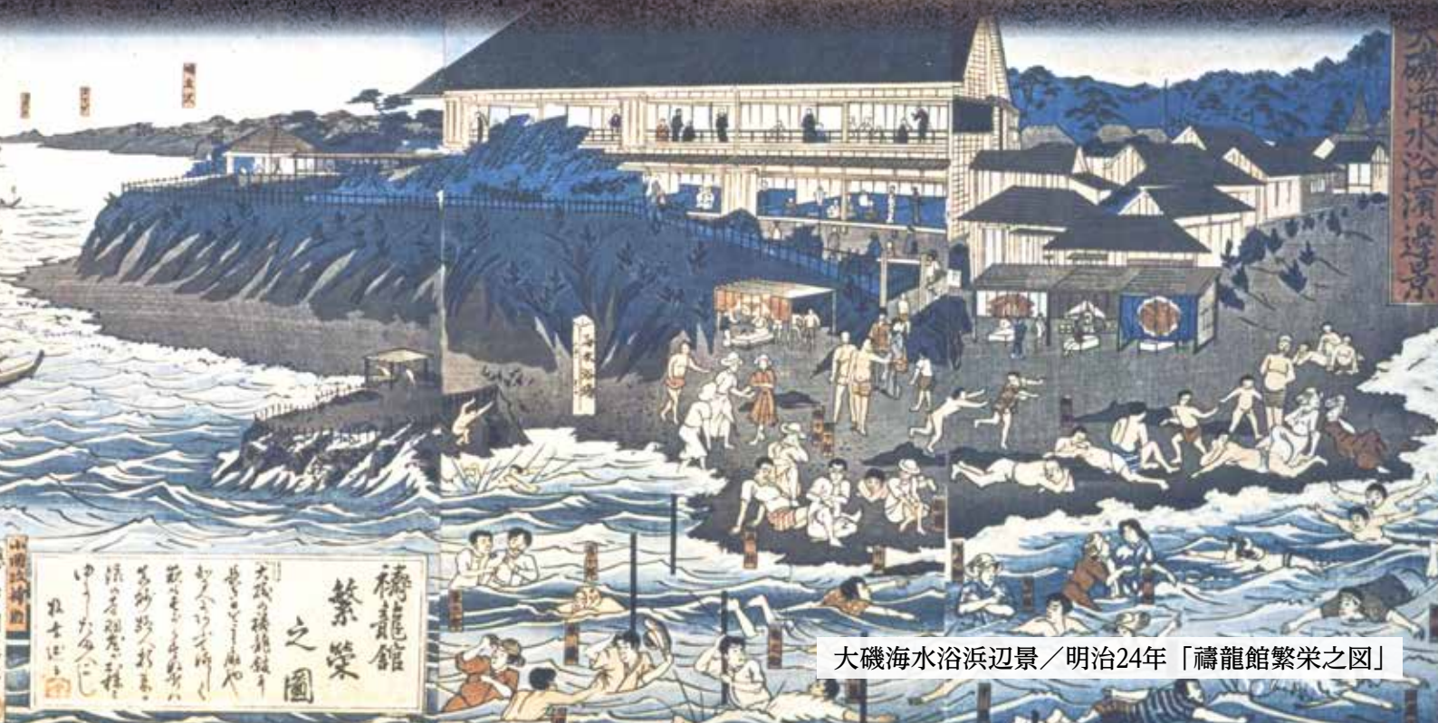
大磯海水浴浜辺景／明治24年「禱龍館繁栄之図」