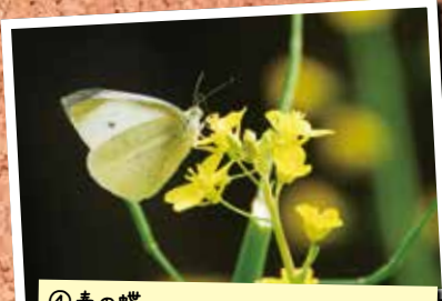
④春の蝶 4/8 寺坂