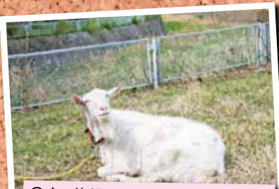
②春の笑顔のヤギ 4/13 国府本郷