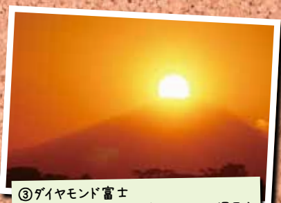
③ダイヤモンド富士 4/9 照ヶ崎海岸