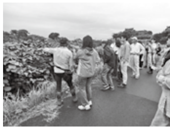
昨年環境点検の様子