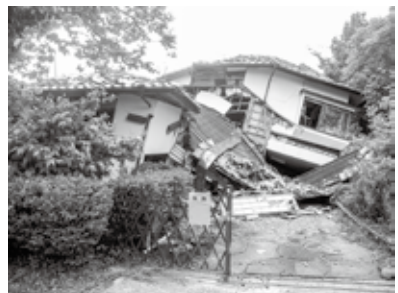
熊本県地震の被災状況