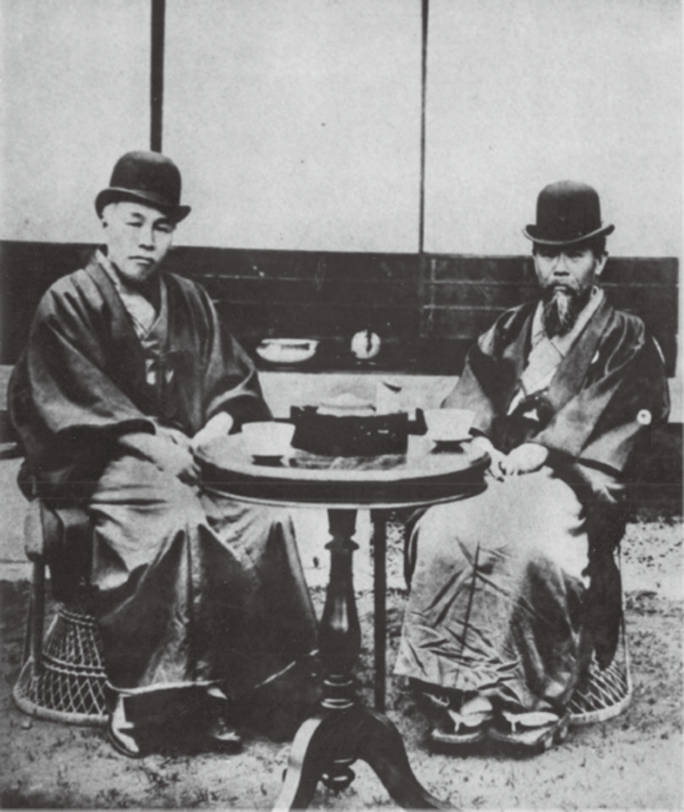
伊藤博文（右）と大隈重信（左）／明治期の政界をリードした2人の貴重な写真。明治31年（1898）、大磯の滄浪閣で撮影された。