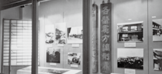
平成4年企画展 「なつかしの風景Ⅱ家と町並み」