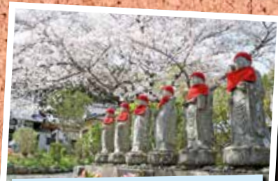
⑤石仏と桜 4/1 東昌寺

町の人口と世帯 人口 31,504 (-9) 男 15,385 (-5) 女 16,119 (-4) 4月1日現在 世帯 12,602 (+38) ( )は前月比