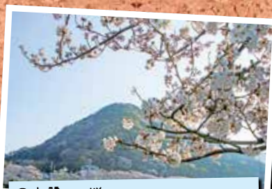
①高麗山と桜 3/28 花水川沿い