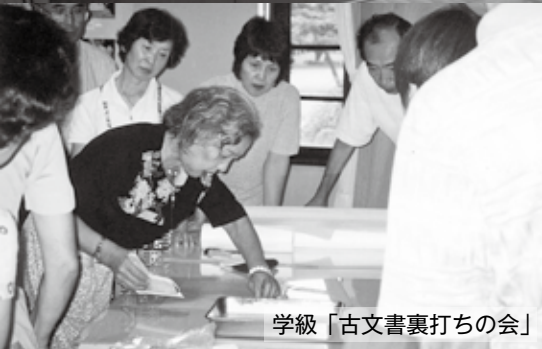
学級「古文書裏打ちの会」