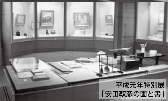
平成元年特別展 「安田鞞彦の画と書」