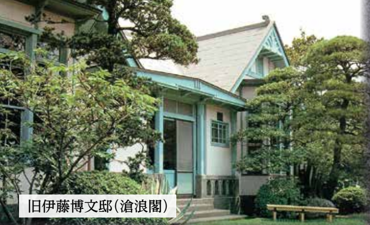
旧伊藤博文邸(滄浪閣)