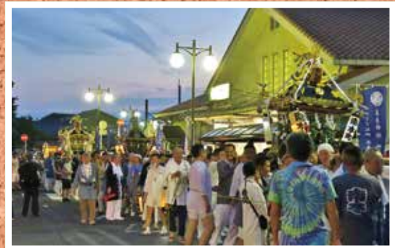
●高来神社夏季例大祭宵宮