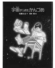
宇宙からきた かんづめ 佐藤さとる/作 ゴブリン書房

ぼくがスーパーマーケットで出会ったのは、おしゃべりをする「かんづめ」だった。 ちよっと不思議な話が詰まったSF童話。