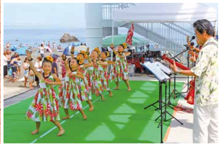
●フラダンスショー