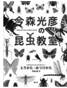
今森光彦の 昆虫教室 今森光彦/作 童心社

図書館では、学年別におすすめの本「夏休みすいせん図書」を選んで、紹介しています。その中から、小学生向けの3冊をご紹介します。