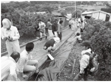
▲6月に行われた講習会の様子