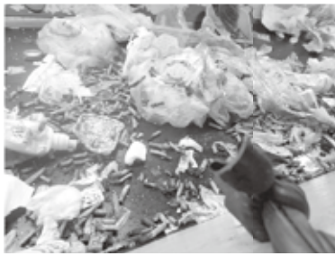
▲処理施設に搬入された異物(たばこ等)

大磯町で収集された容器包装プラスチックは平塚市にある処理施設に運ばれています。搬入先からは容器包装プラスチック以外のものや汚れたものの混入があると報告を受けています。