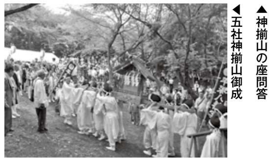
▲神揃山の座問答 ◀五社神揃山御成

寒川神社と川勾神社の「われこそが相模国の一之宮である」という争いを神事化した古式『座問答』（神揃山にて）、今年も「いずれ明年まで」と決着せず、来年に持ち越されるのでしょうか。