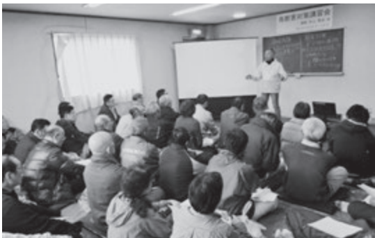
▲10月に行われた講習会の様子