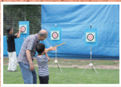
●大磯チャレンジフェスタ2016