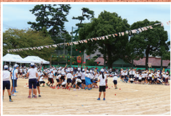
●大磯小学校運動会