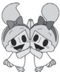
ミビヨーナ・ミビヨーネ 神奈川県未病対策 イメージキャラクター

10月18日(火)、11月14日(月)に未病サポーター養成研修会を開催します。「未病」について興味を持たれたら、ぜひご参加ください。(詳細は情報コーナーに掲載)