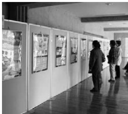
▲3月に郷土資料館で開催したときの様子

9月1日は関東大震災が起きた日として、各地で防災訓練が行われ、巨大災害を意識する機会となりました。町では、関東大震災が起きた数年前の9月30日に、台風による大きな高潮被害を受けました。災害を思い起こすことが多いこの時期に、町の過去の災害を振り返る機会として、「大磯の災害」パネル展を開催します。