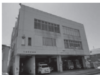
▲消防署・消防本部

今後40年間の総額が約288億円にのぼることが分かりました。さらに道路、橋、公園、下水