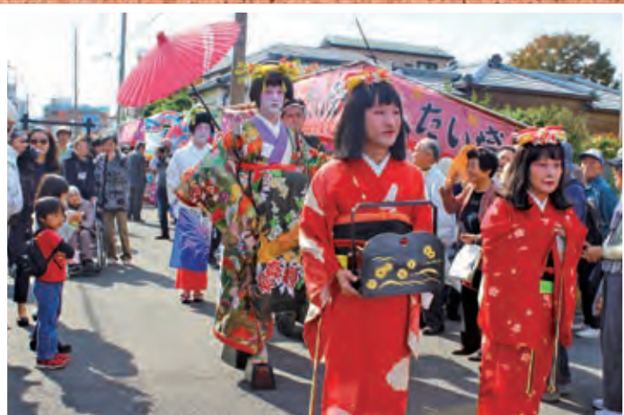
●第22回大磯宿場まつり