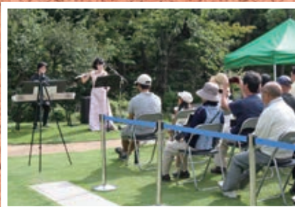
●おおいそ邸園コンサート