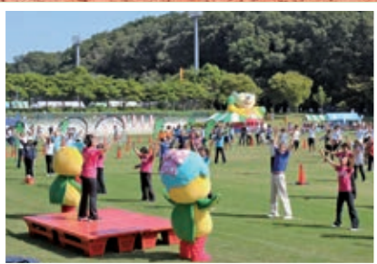
●大磯チャレンジフェスタ