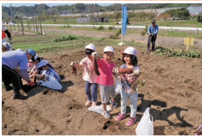
●園児たちの芋ほり体験