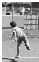
ストライクナイン