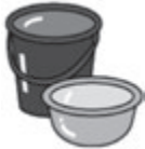
ボウル・バケツ類