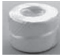
プラスチック製の 荷造りひも、 結束バンド