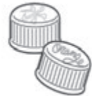
ふた・キャップ類