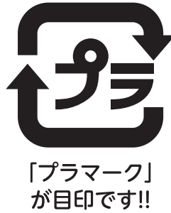
「プラマーク」が目印です!!

プラスチックやビニールをすべて、「容器包装プラスチック」の日に出演していませんか？ 容器包装プラスチックには、「プラマーク」が付いています。