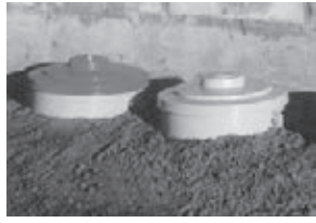
使用中のミラコンポ