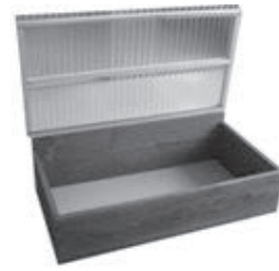
バクテリア de キエーロ