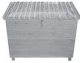
ベランダ de キエーロ