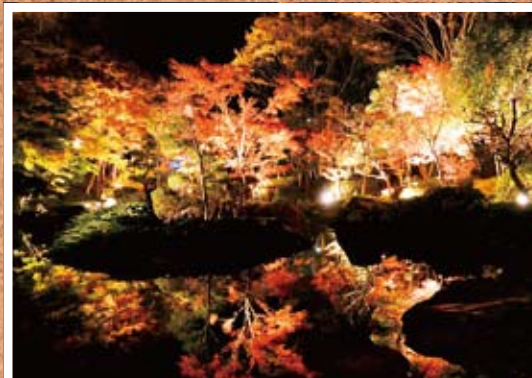
●今年もきれいに衣替えをしました