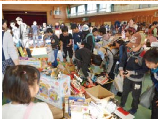
●掘り出し物が見つかったかな? (PTAふれあいバザー) 11/15 国府小学校