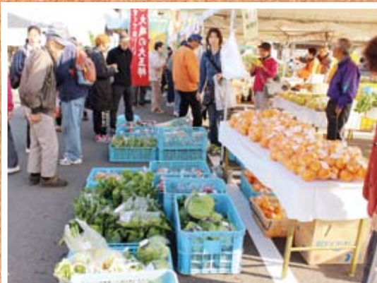
●大磯で栽培された野菜と果物たち (大磯ふれあい農水産物まつり) 11/23 大磯港

町の人口と世帯 12月1日現在 人口 32,440 (+22) 男 15,815 (+11) 女 16,625 (+11) 世帯 12,854 (+19) ( ) は前月比