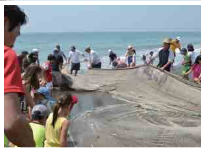
●たくさん穫れたかな? 親子体験教室 5/31 大磯海岸 (☒)