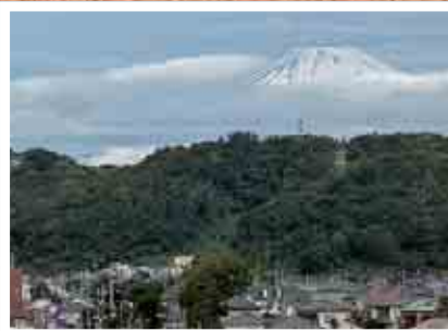
●梅雨空を突いて 6/8 国府本郷 (☒)