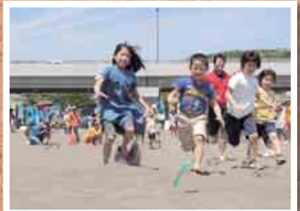
●宝物はここだ! ビーチフェスタ 5/18 大磯海岸 (☒)

町の人口と世帯 6月1日現在 人口 32,447 (-40) 男 15,819 (-11) 女 16,628 (-29) 世帯 12,787 (-10) ( ) は前月比