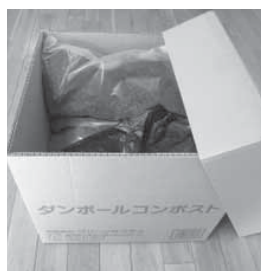
▲ダンボールコンポスト