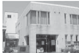
▲国府分館(国府支所内)