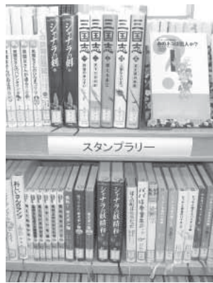
▲スタンプリイの本

図書館推薦の本を読むと、スタン プラリーカードにスタンプを押しま す。集めたカードの枚数に応じてプ レゼントをさしあげます。小学生か ら中学生までが対象です。