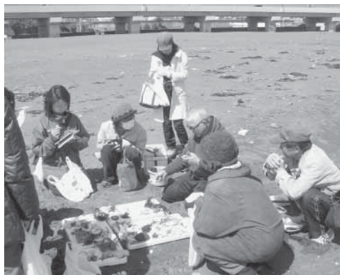
▲漂着物解説の様子