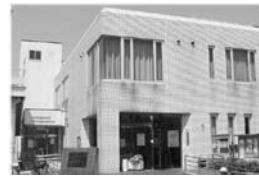
▲国府分館(国府支所内)