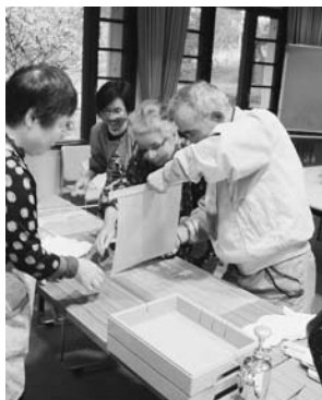
▲「おいそ文化祭」での活動体験

郷土資料館では、古文書の修復を目的として、「古文書裏打ちクラブ」が活動しています。このクラブでは、会員の皆さんが主体となって、古文書の裏打ち作業を行います。常時、会員を募集していますので、関心のある方は、まずは活動を体験ください。