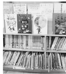
▲スタンプラリーの本

また、おすすめの本2冊を袋に入れた、お楽しみスタンプラリー・スタート・パック(各セット先着20人)も用意しています。