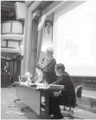
◀公開プレゼンテーションの様子

最近、大磯町を訪れる観光客の皆さんを良く見かけます。これから暖かくなると、街なかを歩く人たちが増えてくると思います。しかし、大磯を訪れる人々が感じる大磯の魅力は何でしょうか。