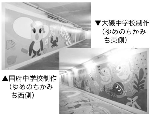
▼大磯中学校制作 (ゆめのちかみち東側)

「わたしたちの大磯」というテーマで、色とりどりの海のイメージが広がっています。ぜひ、ご覧ください。