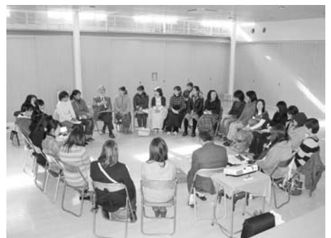
▲卓話集会の様子(たかとり幼稚園)

卓話集会は、町民の皆さんと直接お会いし、ひざを交えた話し合いを行うことで、身近な問題の解決を図ることを目的として、昨年度から実施しています。町内24地区にお邪魔し、過去3回開催してまいりました。