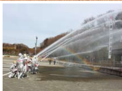
●火災ゼロを祈念 出初式 1/6 大磯運動公園