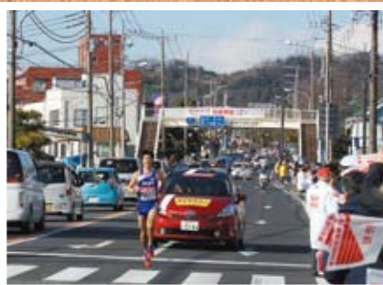
●富士山を背景に疾走 箱根駅伝 1/3 国府本郷