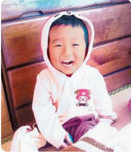
いつもニコニコ元気マン☆