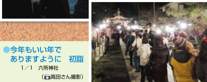
●今年もいい年で ありますように 初詣 1/1 六所神社