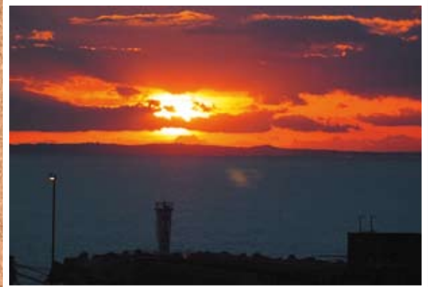
●シンボル灯台越しの初日の出 1/1 大磯