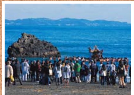
●1年の安泰を祈り 寒中神輿 1/1 北浜海岸

町の人口と世帯 人口 32,688 (− 7) 男 15,932 (− 3) 女 16,756 (− 4) 世帯 12,615 (− 1) ( ) は前月比