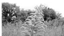
▲セイタカアワダチソウ

外国から入ってきた、野生化した帰化植物。そのうちよく知られるセイタカアワダチソウとオオバタカサの分布状況を調べました。