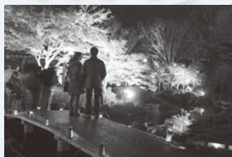
▲不動池に映るもみじ