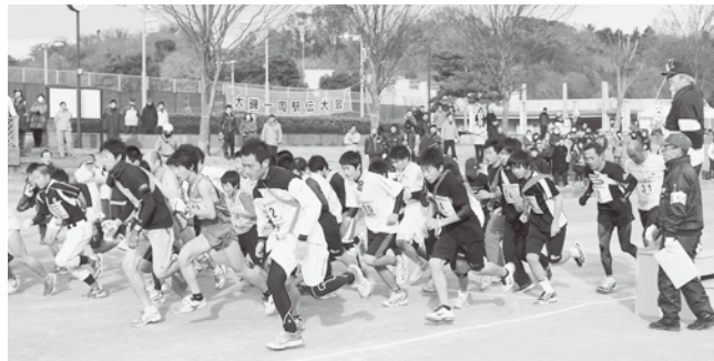
▲スタート直後の様子(昨年)